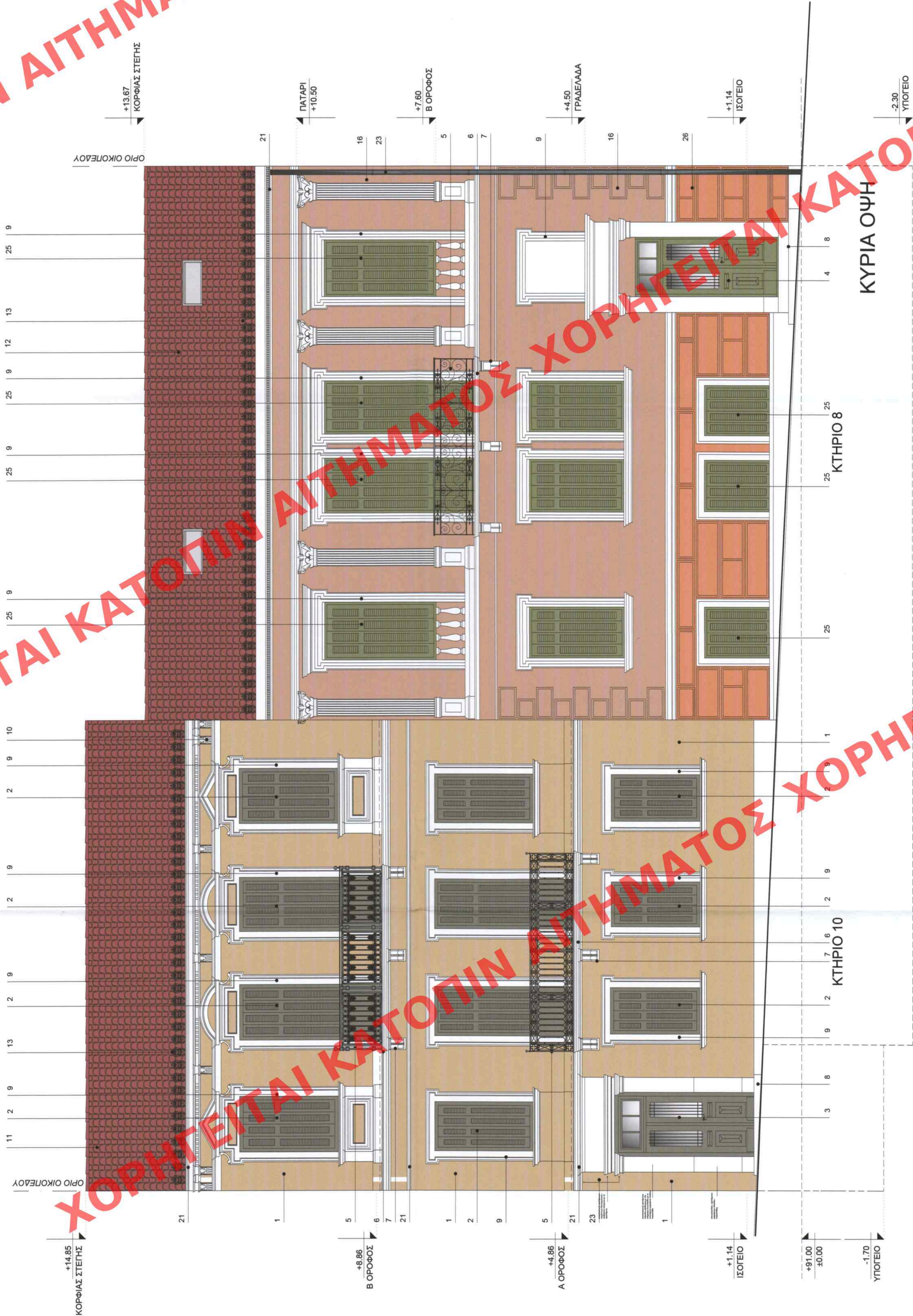
1. ΕΠΙΧΡΙΣΜΑ ΧΡΩΜΑΤΟΣ ΙΔΕΑ CALCE 275 OCRA 1Z